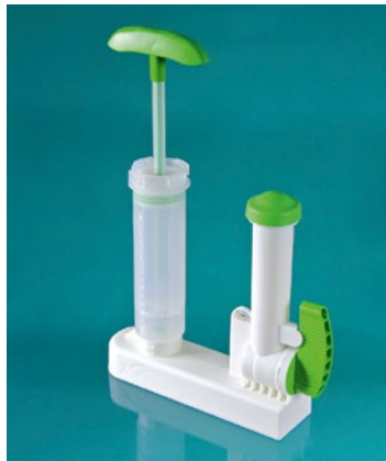
Eine Übersicht einzelner Komponenten und Produkte der MEDMIX Systems AG. Darunter befinden sich Laparoscopic Tips (Abbildung links) und Palacos Pro (rechts). – Produkte für höchste Ansprüche.

gendeinem Server abgelegt. Jedes Dokument hat eine eigene Nummer statt nur eine Datierung. IQSoft erlaubt einzelne Dokumente auszuchecken, anzupassen und wieder einzufügen. Nach dem Update verschiebt sich die nun ältere Version automatisch ins Archiv.